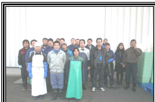
(株)クリーン&クリーン