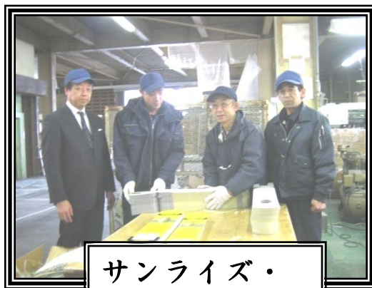
サンライズ・ パッケージ(株)